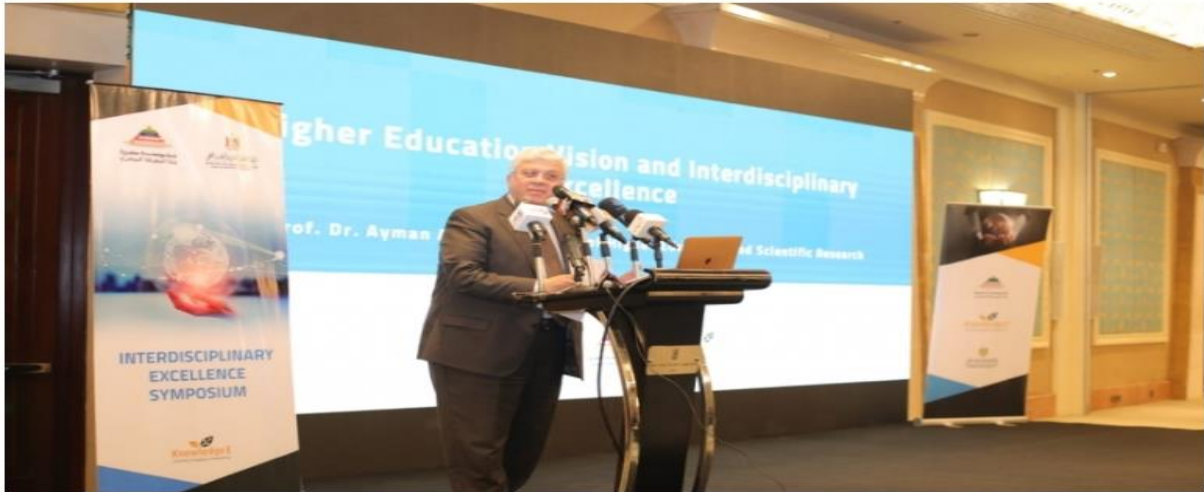
الدكتور محمد أيمن عاشور .. وزير التعليم العالي و البحث العلمي

افتتح الدكتور أيمن عاشور وزير التعليم العالي والبحث العلمي، فعاليات ندوة بعنوان «برامج البحوث البينية ومتعددة التخصصات»، صباح اليوم، والتي تمثل البداية الرسمية لإطلاق الشبكة المصرية القومية للبرامج والبحوث البينية للجامعات المصرية.